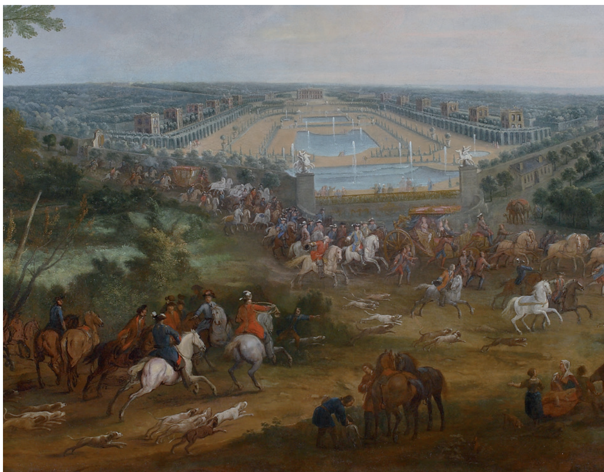
Pierre-Denis Martin, dit Martin le Jeune (attribué à), Départ de chasse à Marly (détail), vers 1720-1730, huile sur toile.

Le Musée du Domaine royal de Marly rouvre ses portes après deux ans de travaux. La manifestation inaugurale fait revivre l'atmosphère au temps de Louis XIV de ce château disparu. PAGE 15